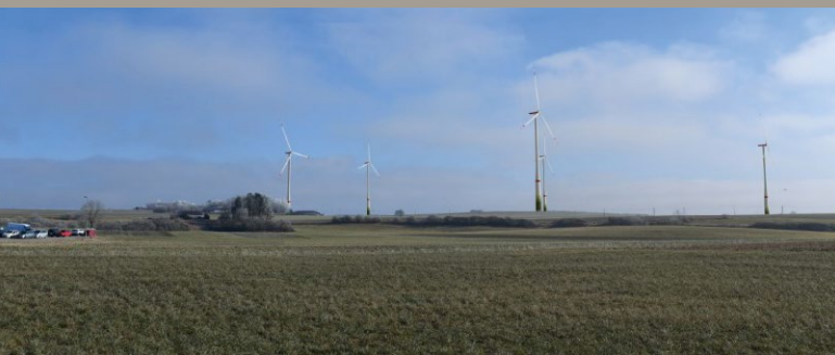
Visualisierung der 5 geplanten Anlagen von der Freiwilligen Feuerwehr aus.

Sollten sich die Kommunen dagegen entscheiden, ihre Flächen zu verpachten, wird der Windpark ausschließlich auf privaten Flächen gebaut. Hierzu bietet das ausgewiesene Vorranggebiet ausreichend Platz. In Fluorn-Winzeln wurden im Nachgang zu einer Eigentümersammlung bereits entsprechende Verträge mit privaten Flächeneigentümern geschlossen.