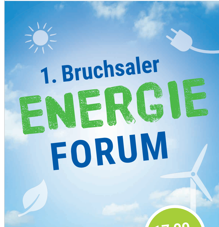
Vi.S.d.P.: Stadt Bruchsal, Oberbürgermeisterin Cornelia Petzold-Schick, Kaiserstr. 66, 76646 Bruchsal